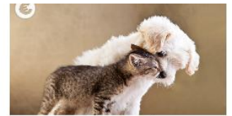
AUDIO: Zavarovanje hišnih ljubljencev je odgovorno in koristno

Samo v letu 2021 je osmij dosegel 24-% donos.