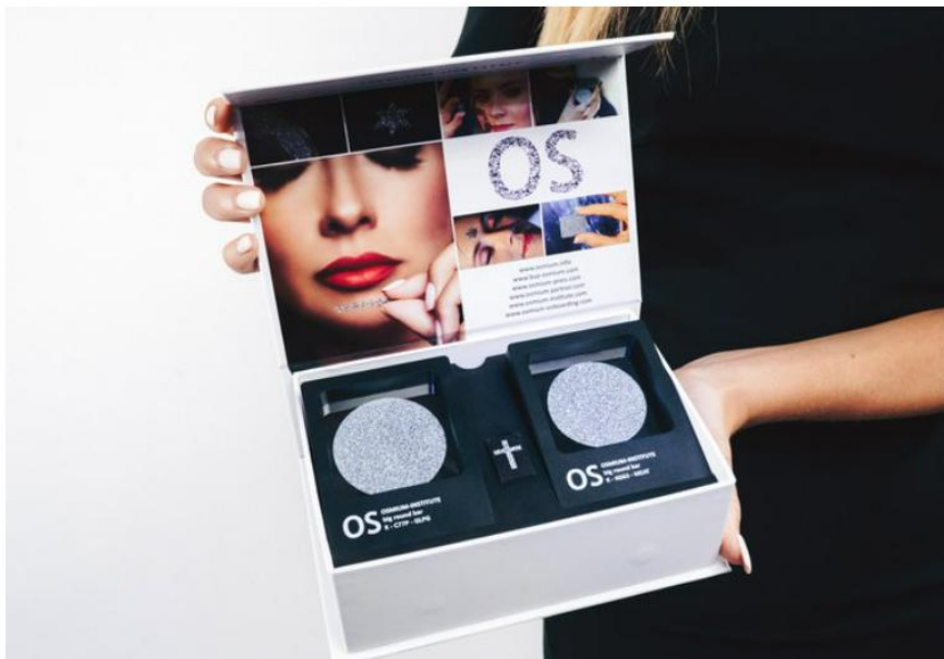
Osmij je samo v letu 2021 zabeležil 24-odstotni donos.

Naložba v osmij je varna, ker jo nadzorujejo in vodijo pooblaščen inštituti, teh je na svetu 20, enega imamo tudi v Sloveniji.