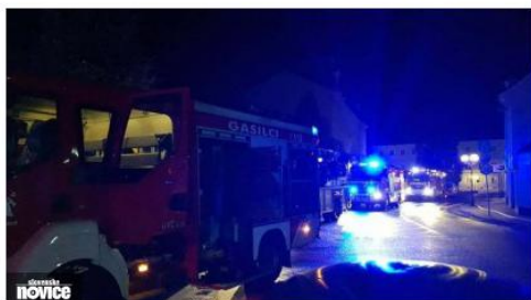
Razgledni stolp pogorel v celoti

Vsak nakup šteje Vse koristne vsebine na enem mestu: podprite slovenske pridelovalce.